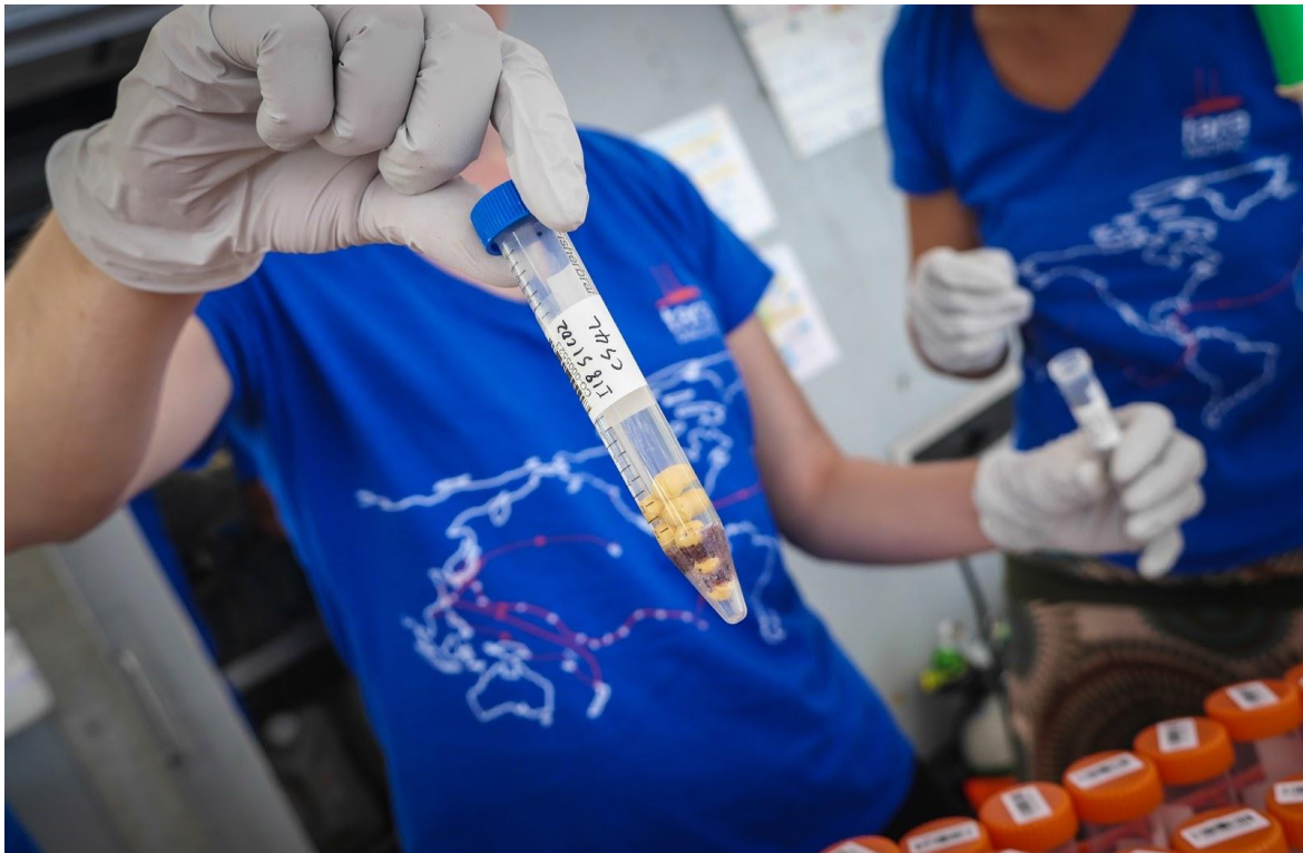
Échantillon de corail