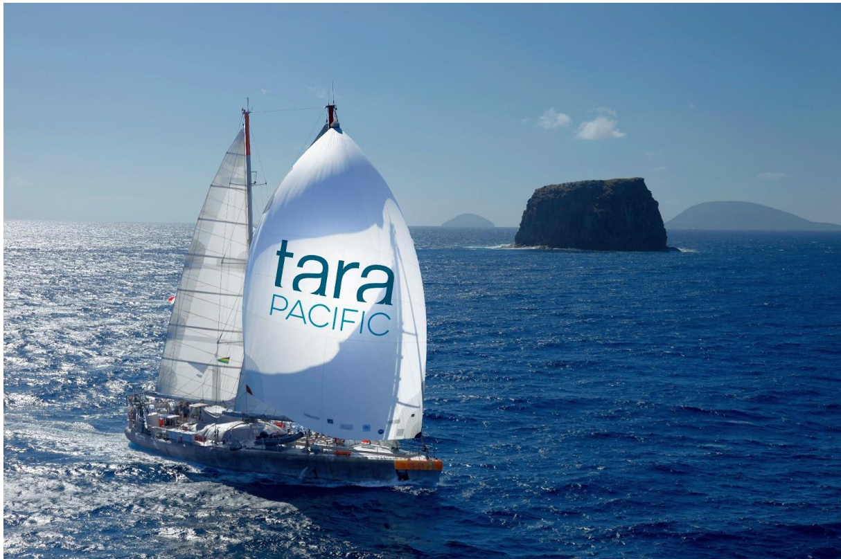
La goélette Tara sous spi lors de l'expédition Tara Pacific (2016-2018)