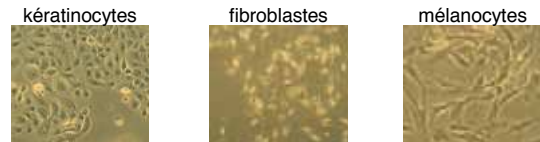
Les trois types de cultures primaires de cellules cutanées utilisés

Au niveau cellulaire, nos études ont montré que l'induction de CPDs dans des kératinocytes humains contribuait significativement à la mutagenèse . De plus, cette réaction photochimique est efficace sur une large portion du spectre UVA . Par ailleurs, nous avons mis en évidence que les CPDs étaient très lentement éliminés après exposition de cellules et de peau (explants humains) aux UVA. Enfin, les mélanocytes en culture se sont montrés plus sensibles que les kératinocytes au stress oxydant induit dans l'ADN par les UVA, alors que le rendement de CPDs est le même dans les deux cas.